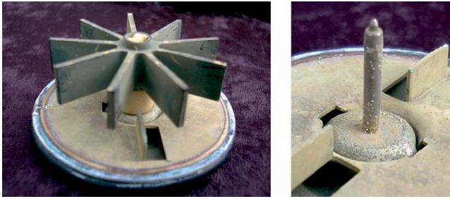
Abb. 1: Ergänzend zur Einzelprüfung werden auch Messungen auf einem Reihenprüfstand vorgenommen, bei dem jedes Gerät auf zulässige Toleranzen getestet wird.

Eine mit ungeeichten Zählern erstellte Abrechnung ist nicht fällig.