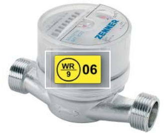
Abb. 5: Eichmarken sind auf dem Messgerät manipulationsicher angebracht.

Eichbehörde, so hat das mit Sicherheit teure Konsequenzen zur Folge. Die Eichbehörden sind gesetzlich verpflichtet, der Sache nachzugehen. Sie werden dem Betreiber der betroffenen Messgeräte garantiert die Auflage zur unverzüglichen Nacheichung machen und daneben eine ordentliche Geldbuße verhängen, die sich nach unseren Erfahrungen zwischen 100 und 200 Euro pro ungeeichtem Messgerät beläuft. Ein rechtzeitig neu eingebauter Wasser- oder Wärmezähler wäre in diesem Fall weitaus billiger gewesen. So mancher Vermieter wurde aus Schaden klug.