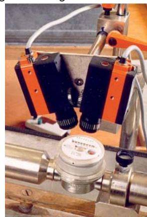
Abb. 2: Jeder Wasser- und Wärmezähler wird bei der Eichung auch einzeln auf seine Funktionsfähigkeit geprüft.

Ganz wichtig: Für die Einhaltung der Eichfristen ist der Besitzer der Messgeräte verantwortlich. Eine gesonderte Anforderung, z. B. vom örtlichen Eichamt, bekommt er dazu nicht. Als Besitzer der Messgeräte gilt bei Mietwohnungen selbstverständlich der Vermieter und in Eigentumswohnanlagen jeder Wohnungseigentümer für sich. Der Wohnungsverwalter ist im Sinne des Eichgesetzes eigentlich unbeteiligt, es obliegt aber seiner Sorgfaltspflicht, die betroffenen Wohnungseigentümer über die gesetzlichen Notwendigkeiten zu informieren. Eindeutig ist, dass ein Eigentümerbeschluss, der die Nacheichung von Messgeräten ablehnt, gegen gesetzliche Vorschriften verstößt und somit einer ordnungsgemäßen Verwaltung widerspricht. Ab dem Moment des Geräteerwerbs geht die Verantwortung für die Einhaltung des Eichgesetzes auf den Besitzer des Messgerätes über. Das ist erfahrungsgemäß leider sehr häufig nicht bekannt und führt dazu, dass eine notwendige Nacheichung nach Ablauf der Eichgültigkeit kaum jemanden interessiert, bzw. erst dann, wenn es Ärger gibt.