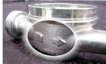
Abb. 8: Der Richtungspfeil auf oder in dem Gehäuse des Wasserzählers ist wichtig. Falsch herum eingesetzte Wasserzähler entsprechen nicht dem Eichgesetz.

ein Monteur nicht auf die Einbaurichtung achtet und der Wasserzähler dann rückwärts läuft und deshalb auch rückwärts zählt. Entgegen einer weit verbreiteten Meinung ist der umgekehrte Einbau eines Wasserzählers nicht nur ein 'kosmetischer' Fehler. Weil die Prüfbedingungen bei der Geräteeichung einen korrekten Einbau voraussetzen, gilt die Eichzulassung auch nur für in ordnungsgemäßer Richtung eingesetzte Zähler. Ein falsch herum montierter Wasserzähler besitzt keine Eichgültigkeit und ist für den geschäftlichen Verkehr und Abrechnungszwecke mit Wohnungseigentümern und Mietern nicht zugelassen.