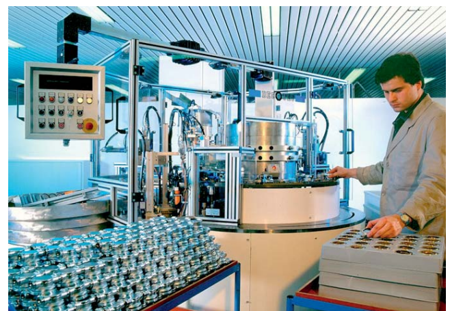
Abb. 1: Ergänzend zur Einzelprüfung werden auch Messungen auf einem Reihenprüfstand vorgenommen, bei dem jedes Gerät auf zulässige Toleranzen getestet wird.

Heizkostenverteiler unterliegen nicht der Eichpflicht. Das gilt sowohl für Geräte nach dem Verdunstungsprinzip, wie